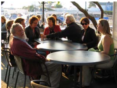
Lederne i Oslo og Akershus fikk mange nyttige innspill om systemrettet arbeid på lederforum i Drøbakk 5. og 6. september. Nå legges erfaringene ut på nett.

Fra PPT/OT fikk vi erfaringer fra arbeidet i tverrfaglige team i videregående, om tverrfaglige systemtiltak i forhold til rus og det psykososiale miljøet. Det ble påpekt at skal teamet ha legitimitet må ledelsen være representert.