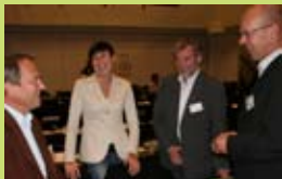
Interessante forelesere på Nordisk LP-konferanse.

http://www.eldhusetfagforum.no/lp-modellen/